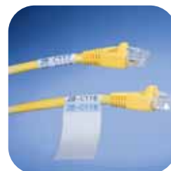
Draht- und Kabelkennzeichnung