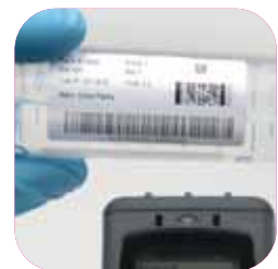
Kennzeichnung im Labor und Gesundheitswesen