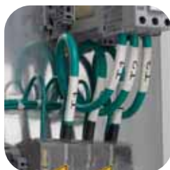
Draht- und Kabelmarkierungsschläuche